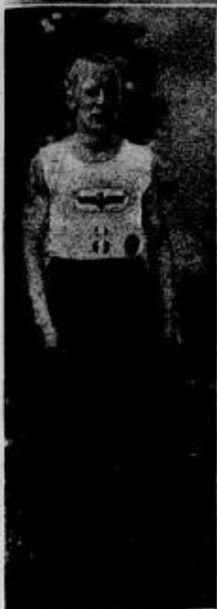
Deutsche Läufer siegreich in Paris