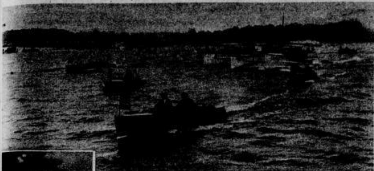
Motorbootrennen auf dem Seddiner See bei Potsdam. Start aller Klassen