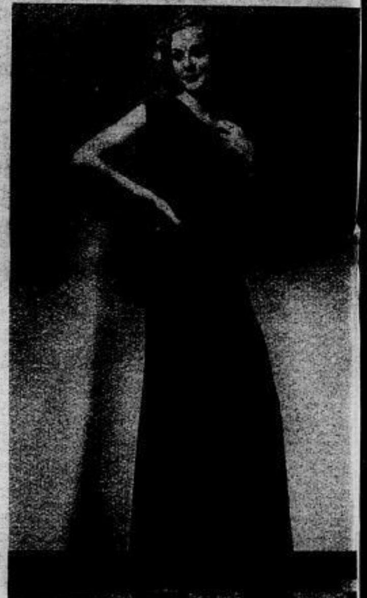
Einfaches, aber gefälliges ärmelloses Nachmittagskleid aus dunklem Stoff mit weißem Punktmuster