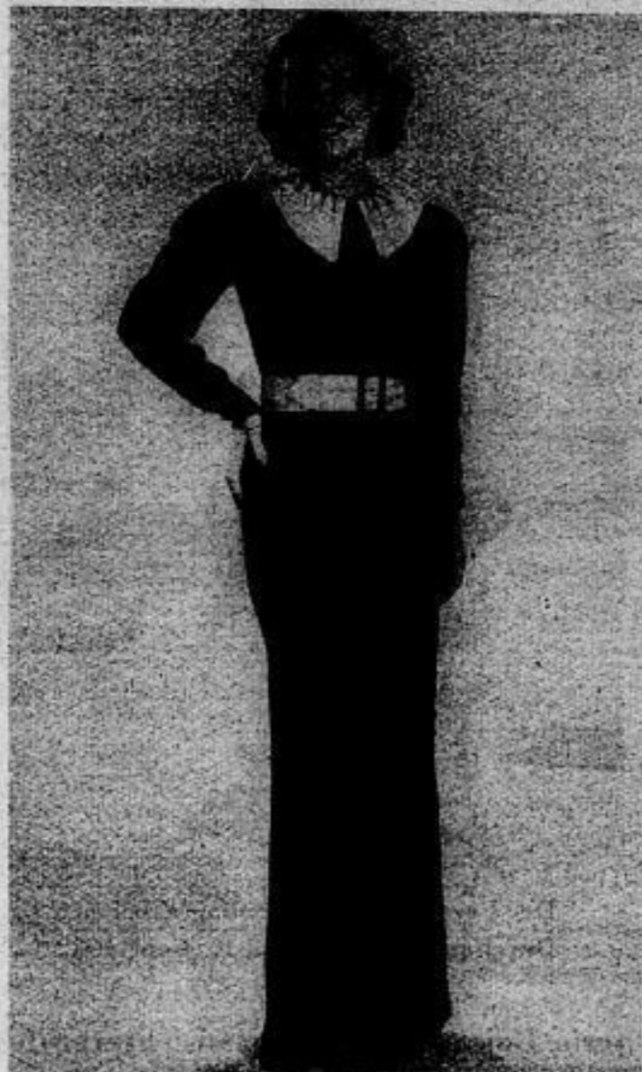
Schwarzer Krepp mit weißem Kragen und Gürtel. Perlen und Rheinkiesel verzieren beide