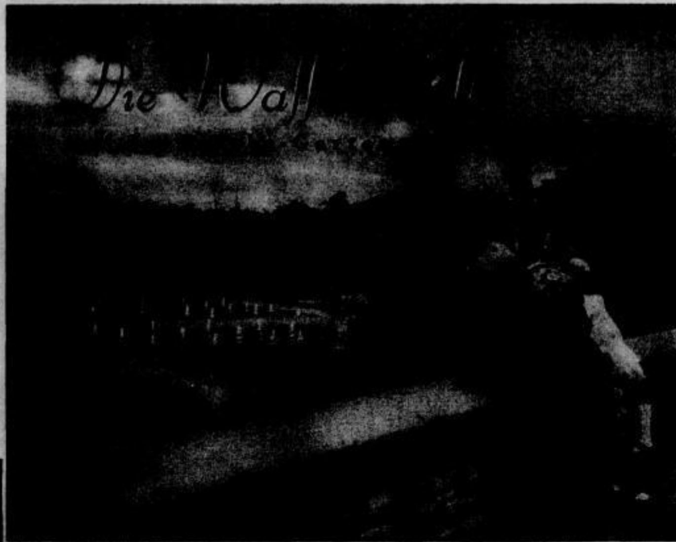
Bild rechts: Weltes bergiges Gelände wurde in die Ausstellungsfläche mit hineinge- bracht. Zwischen den Felsen große Wasserbeden