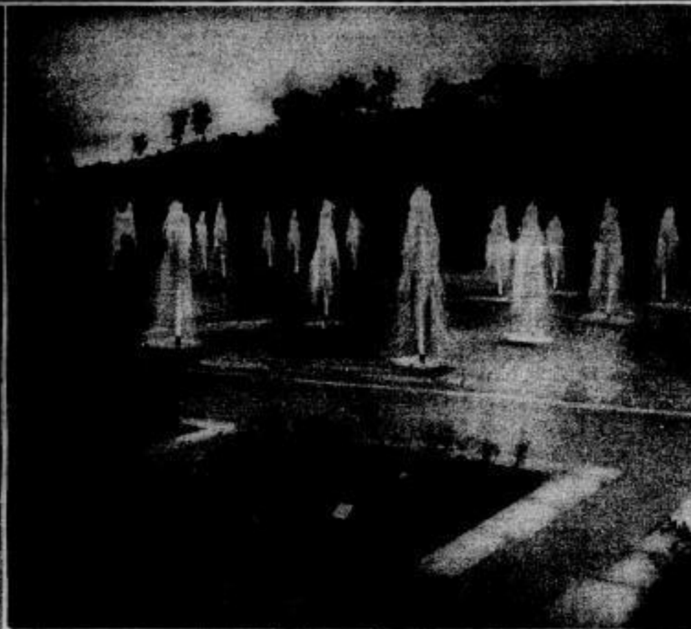
Springbrunnen, die automatisch wachsen und fallen

Rechts: Auch so etwas gibt es: In einem Terrarium nehmen Riesenschild- kröten ihre Mahlzeit ein