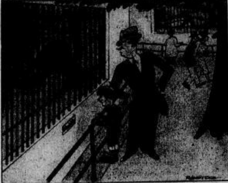
„Bati, der könnte Nutti sein bei der Wäsche helfen!“