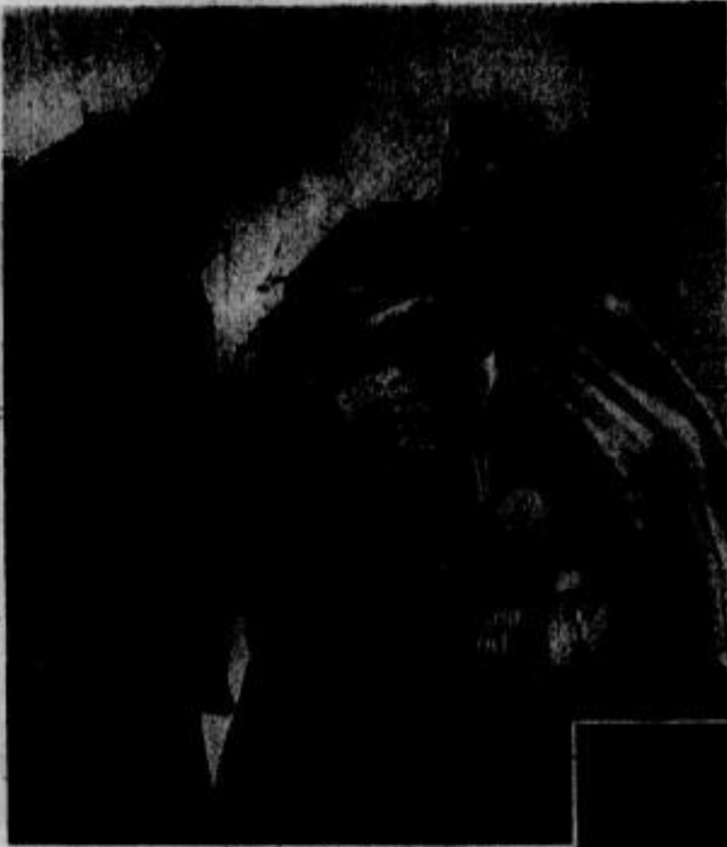
Rechts: Der Schiedspruch von Wien, der einen wichtigen Schritt auf dem Wege zur Befriedung Europas bildet, bewies auch neue den energischen Willen sowie auch die Fähigkeit der Achsenmächte, alle noch schwebenden strittigen Fragen einer klaren und gerechten Lösung zuzuführen. Unser Bild zeigt den ungarischen Ministerpräsidenten Graf Taki (links) und den ungarischen Außenminister Graf Csaky (rechts) beim Kartentisch.