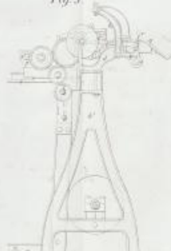
Durchschnitt nach C D.