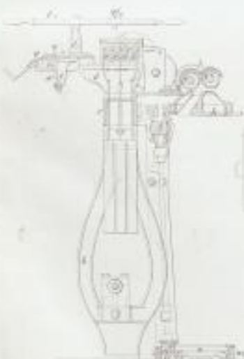
Durchschnitt nach A B.