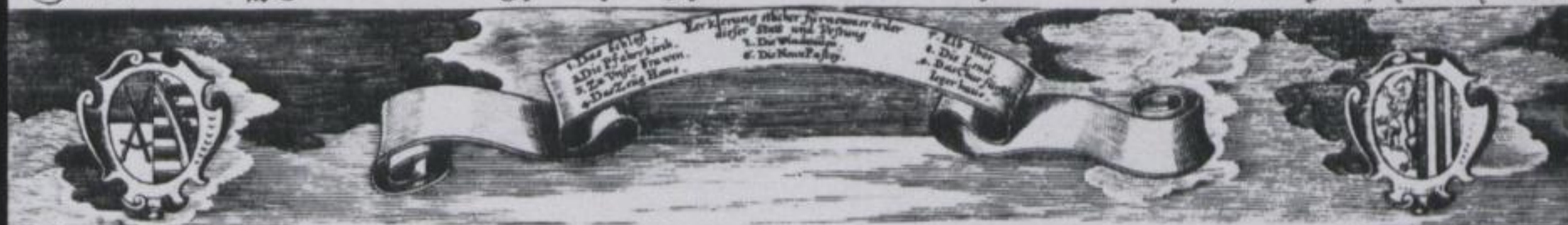
Abbildung d. weitberühmten Churfürstl. Residentz, Stadt und Festung DRESDEN.