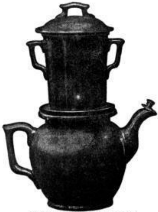
(Aufgusskanne für Kaffee und Thee.)

Ausserordentlich aromatischer, ausgiebiger und wohlschmeckender