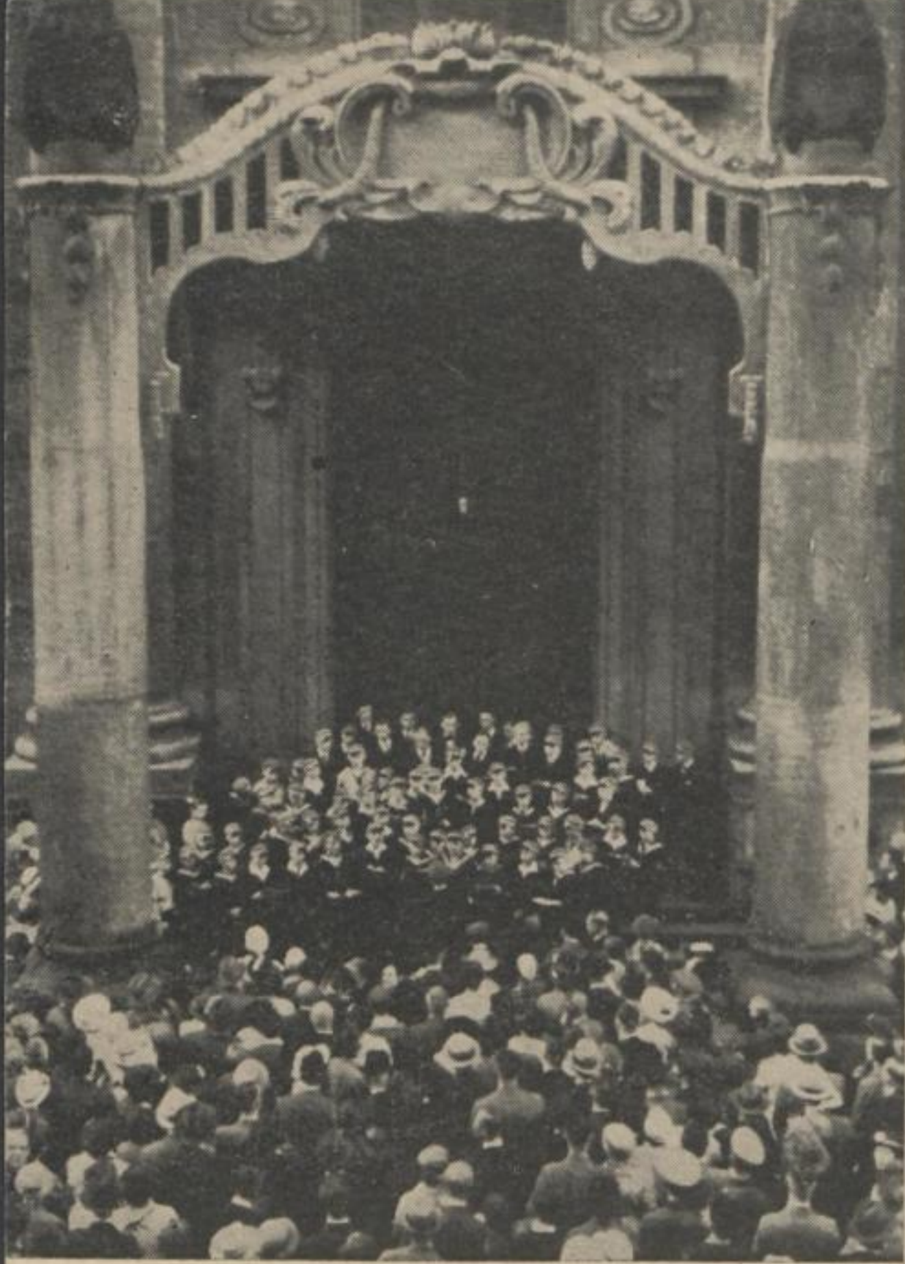
A Kreuzchor szabadtéri hangversenyen énekel a „Kreuzkirche“ előtt.