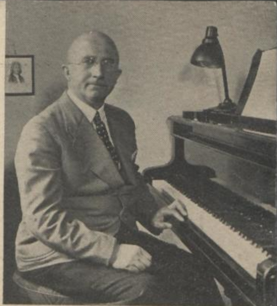
Prof. Rudolf Mauersberger, a Kreuzchor karmestere

1935-ben került sor első amerikai hangversenykörútjukra, s ez világhírt szerzett a kitünő fiúkarnak. Elisabeth Rethberg, a nagynevű énekesnő patronátusa alatt érkezett Newyorkba a kórus. Hatalmas vihar hátráltatta megérkezésüket, de a hajó kikötése után két órával már Newyork legelőkelőbb közönsége előtt koncerteztek a Metropolitan-opera színpadán. Négyezer hallgató tapsa pecsételte meg a világrészre szóló sikert. Nyolchetes körútja alatt a