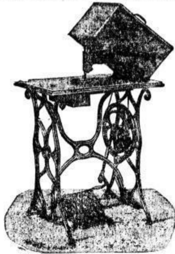
Lit. A mit Verschluss.