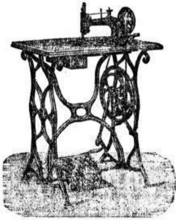
Lit. A für Familie.

Abzahlung von 6 Mark pro Monat. Drei Jahre Garantie.