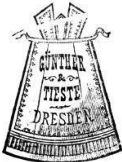
Platze stellen kann.

Gratis jedem bei Abnahme von 6 Paar eine elegante Handschuh-Cassette.