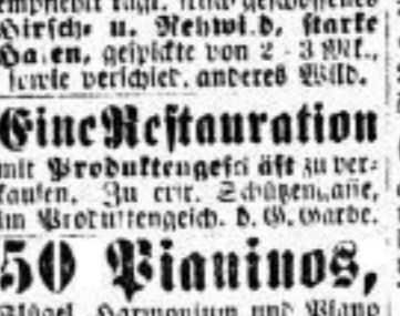
Wild-Handlung von C. Müller...