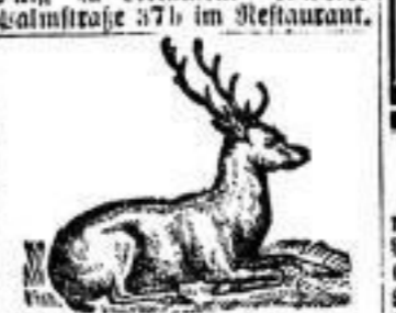
Wild-Handlung von C. Müller...