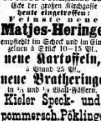
Grosse Frohngasse 23, heute eingetroffen: Feinste neue Matjes-Heringe...

Matjes-Heringe. In 1/2 und 1/4 Schöpf-Dosen, groß und mittel, für den Export.