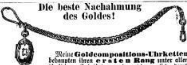
Die beste Nachahmung des Goldes!

vom 1. October d. J. ab Galeriestraße 18, 2. Stg.