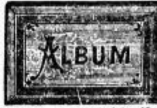
Poesie- und Einschreib-Albumb von 50 Pf. bis 8 M.