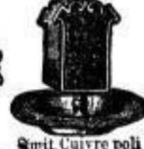
mit Cuivre poli Stück 75 Pf.