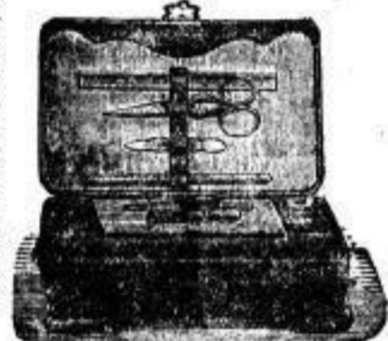
von 2-30 Mark.

Star. massiv Gold, mit feinst. imit. Brillant, 5-10 M.