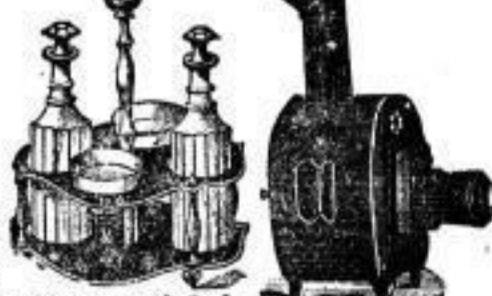
Essig- und Öl-Mengen