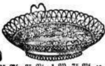
85 Pf., 75 Pf., 1 M. 75 Pf. an. Paar 2 M. 50 Pf. für Kinder, 3.50 für Erwachsene.