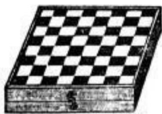
von 50 Pf. bis 12 M.

in nur soliden Einbänden von 1 M. 50 Pf. an, mit echtem Goldschnitt von 2 M. an. Ausserdem empfehle f. Gesangbücher in Leder und Plüsch.