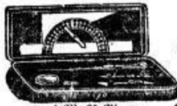
von 1 M. 25 Pf. an.