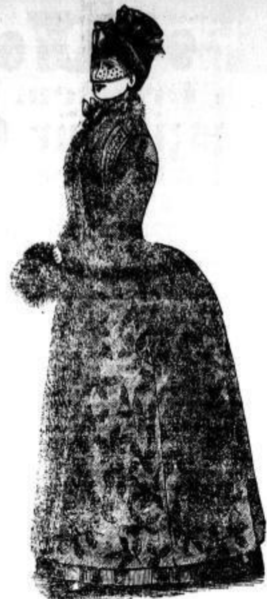
Mantel Zamora geblumte Seide, Prima-Feh- rücken natureller Stunkebesatz 500 Mark.

Dresdener Nachrichten Nr. 345. Seite 26. Sonntag, 11. Dec. 1887