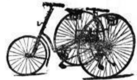
Doppelsitziges Dreirad „Victoria“.

Kinder-Zwei- und Dreiräder in großer Auswahl. Illustrierte Preislifte gratis und franco. Hauptniederlage der Nähmaschinen- und Fahrräder-Fabrik vorm. Seidel & Naumann, Dresden. Dresden, H. Niedenföhr Dresden, Wallstrasse 13.