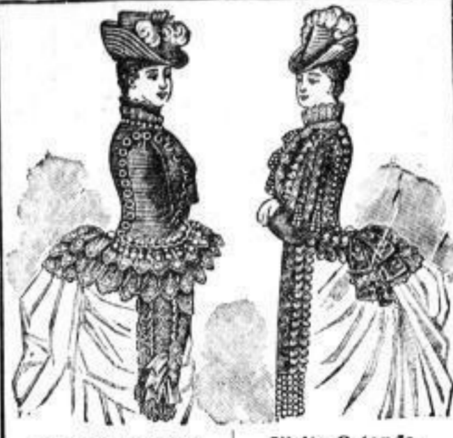
Umhang Nareiss. Kleidung für Frauen, elegant mit Spitzen Nr. 14, prima Ausführung Nr. 17-26, hochlegant Nr. 27-45.