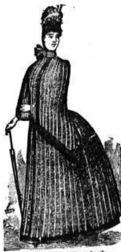
Eleganter Havelock 14-30 Mk.

Dresdner Nachrichten. 1888. Seite 20. Sonntag.