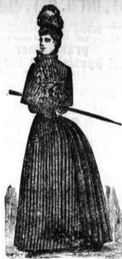
Kleidsamer Regenpaletot 9-20 Mk.