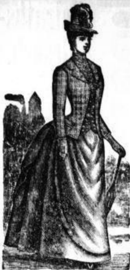
Chices Jäckchen 31-12 Mk.