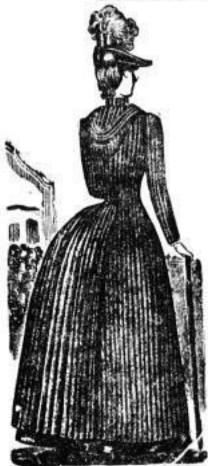
Praktischer Regenmantel 7-12 Mk.

Meine Waarenlager, welche auf das Reichhaltigste sortirt sind, bieten eine sehenswerthe und überraschend grosse Auswahl in tadellos sitzenden und entzückenden Façons.