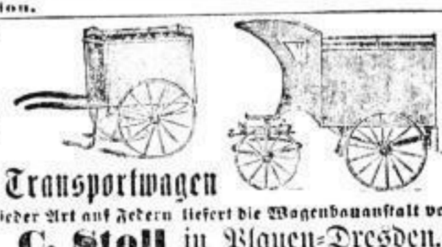
Transportwagen jeder Art auf Aktien liefert die Wagenbauanstalt von C. Stoll in Plauen-Dresden.

Dresdner Nachrichten. Sonntag, 6. Mai 1888. Nr. 127. Seite 16.