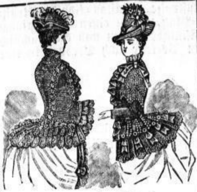
Visite Patti. Umhang für Frauen (eigene Spezialität) Nr. 12-20, ele- gant Nr. 15 bis 22, hoch- elegant Nr. 24 bis 30.