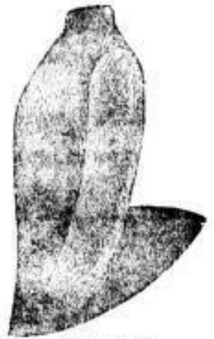
Damen Alice Mark 190. II. Qualität. • 230. I. • 260. Extra-Qualität

Das Magazin kann in Sealskin eine große Auswahl bieten und zu billigen Preisen verkaufen, weil es den Artikel im Großen (en gros) fabricirt. Außer obengenannten Dingen befinden sich eine Menge anderer Modelle in Sealskin auf Lager. Der jährlich neu erscheinende, mit Freisouvenir verbundene illustrierte Katalog des Magazins wird auswärtigen Kunden auf Wunsch per Post zugelandt.