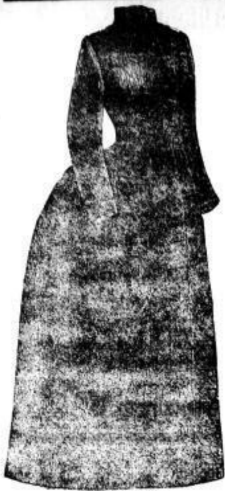
Damen Victoria 138 Ctm. lang, Mark 700-850.