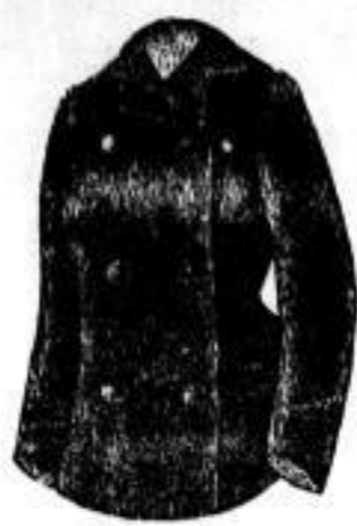
Damen Philippine Mark 300-350.