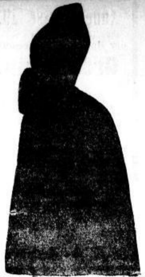
Damen Augusta mit Viberbesatz, 140 Ctm. lang, Mark 1300.