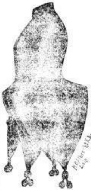
Damen Chicago Mark 360.

hat eines seiner großen Schaufenster ausschließlich mit echten Sealskin decorirt.