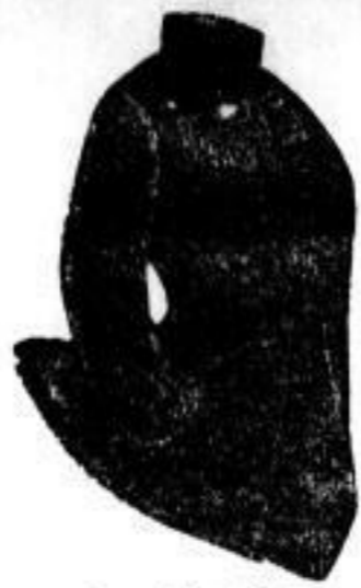
Damen Excelstor Mark 300-350.