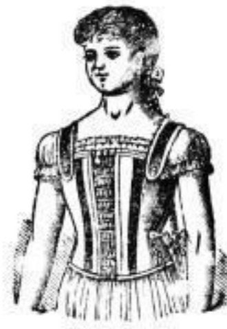
Grün Drell mit roten Streifen 2 1/2 Mk.

Berner gestatte mir darauf aufmerksam zu machen, daß ich im Hinblick auf die bevorstehende Weihnachtszeit mein ohnehin so reichhaltiges Corset-Lager noch mit vielen neuen Nummern, sowohl billigen wie feinsten Genres bereicherte, welche hauptsächlich in neuen glatten und sangarten bunten Farben hergestellt, vermöge ihren gefälligen Ansehens und exquisiten Façons zu zahlreichen Weihnachts-Einkäufen veranlassen dürften, umso mehr, da in Anbetracht dessen die Preise derselben äußerst billig notirt sind.