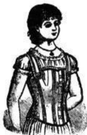
In feinem Drell mit Schnuren 3 Mk.

Corsets , einfach, bequem von —,50 Pf. an Corsets mit Fischbein, in allen existirenden Nähr-Corsets von 7 1/2 Mk. bis 10 Mk. Kinder-Corsets , Corsets , fest, gut sitzend . . . —,90 . . . Farben und Stoffen, in verschiedenartigster Umstands-Corsets 6 1/2 . . . 17 . . . Leibchen v. 50 Pf. an, mit Rech. v. 90 Pf. Corsets do. m. Büffelmech. . . 1,— . . . Ausführung und beststehenden Façons von Faulenzers , ein elastisches Corset für ältere an, beögl. mit Schnuren v. 2 Mk. an, beögl. m. Corsets do. mit Häufelb. . . 1,50 . . . 2 Mark 25 Pf. bis 18 Mark. Damen von 7 . . . 10 . . . Fischbein v. 2 1/2 Mk. an, mit Heben u. Federzug Corsets do. mit Schnuren . . . 2,— . . . Atlas-Corsets mit hochfeiner Ausstattung, Woll-Corsets , Reit-Corsets etc. etc. v. 2 1/2 Mk. m. Heben zum Anziehen von 3 Mk. Corsets do. m. Stahlspänen . . . 2,25 . . . im Preise bis zu 50 Mark. an, Gerdehalter von 1 1/2 Mk. an bis 10 Mk.