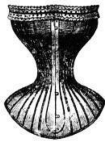
Fischbeincorset in allen Farben, auch mit sam. Mech. v. 5—16 Mk.