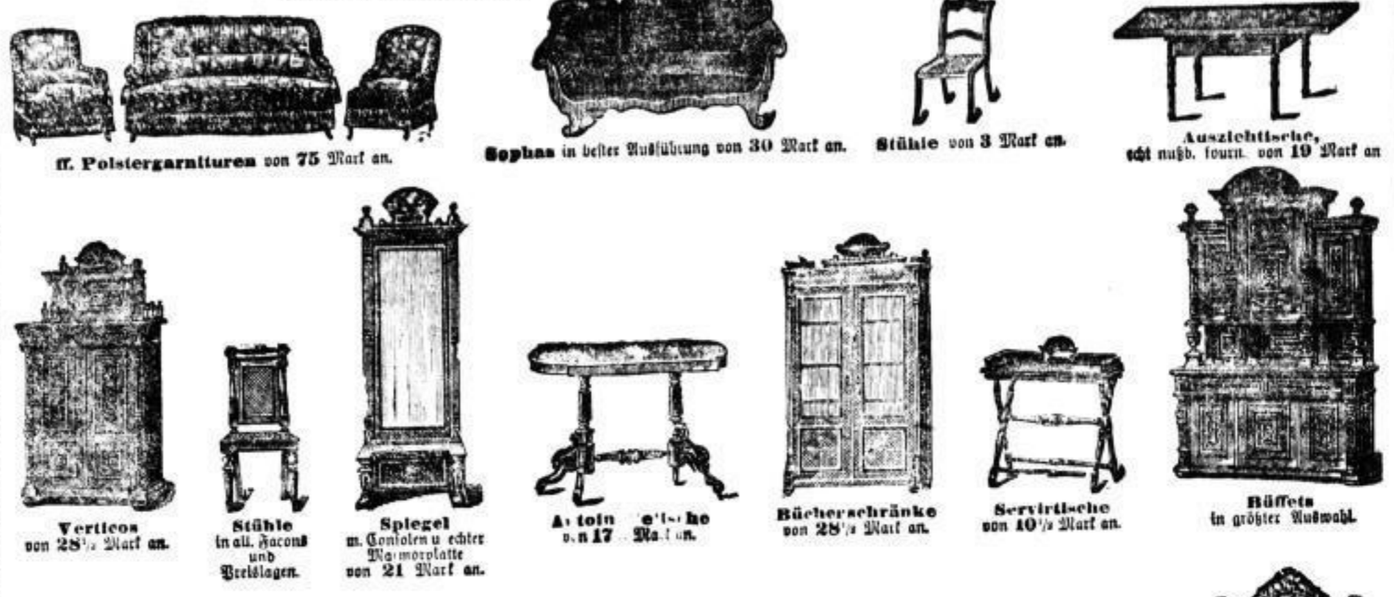
ff. Polstergarnituren von 75 Mark an. Sofas in bester Ausführung von 30 Mark an. Stühle von 3 Mark an. Ausziehtische, sehr nutz. f.ourn. von 19 Mark an. Verticos von 28 1/2 Mark an. Stühle in all. Facons und Bezügen. Spiegel in Contoren u. echter No. morislatte von 21 Mark an. A. teln e' l' ho u. n 17 Mark an. Bücherschränke von 28 1/2 Mark an. Servirtische von 10 1/2 Mark an. Buffets in größter Auswahl. Schränke von 17 Mark an.

Dresden, König-Johann-Strasse Nr. 15, I. Größtes Lager für herrschaftliche und bürgerliche Einrichtungen.