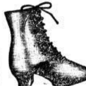
Lederschuhe mit Holzsohlen für Erwachsene und Kinder.

Einziges Mittel, die Füße gegen Kälte und zugleich gegen Nässe zu schützen. Wasser, Beißflöhe gratis und franco. Umtausch bereitwilligst.