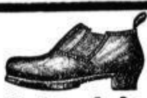
Lederschuhe mit Holzsohlen.

berühmter Fabrik, vorzüglicher Ton, soll ganz außerordentlich billig mit großem Verlust verkauft werden. Willenstraße 45, Gartenhaus part.