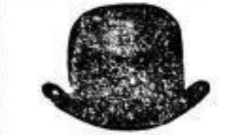
1 brauner Hut, . . . 2 M.