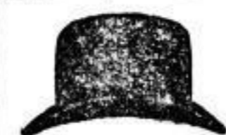
1 Hut in allen Farben und Facons, . . . 3 M.