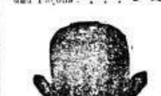
1 Hut, hochlegant, in gewähltesten Farben 4 M.