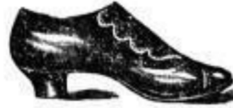
Form „Medusa“, zum Knöpfen, aus Ziegenchagrin oder mit Kalbleder-Blättern, mit schwarz oder gelb gedoppelten Sohlen, Mk. 6.50.