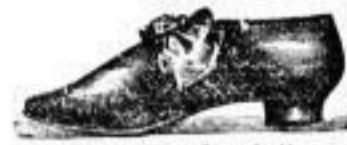
Form „Stephanie“, leichtester Promenadenschuh aus einem Stück, von ganz feinem Leder, für emp- findliche Füsse.

Wiener Schuhwaaren- Depot F. & A. Hammer, 21 Schloss-Str. 21, neben dem Kgl. Schloss.