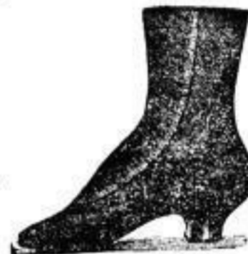
Form „Comfortable“ von feinstem Chevreau-Leder (Marke Grisson, Paris).

Wiener Schuhwaaren- Depot F. & A. Hammer, 21 Schloss-Str. 21, neben dem Kgl. Schloss.