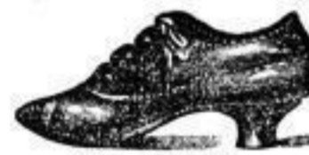
Form „Adria“, eleganter Strassenschuh von Glanz- Dangle-Leder. Mark 10.—.