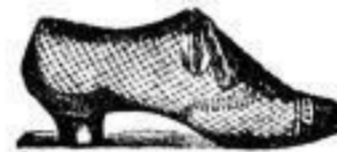
Form „Amazona“, modernster Touristen- und Strandschuh. Mark 1.50.

Wiener Schuhwaaren- Depot F. & A. Hammer, 21 Schloss-Str. 21, neben dem Kgl. Schloss.