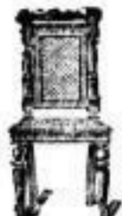
Stühle in allen Facetten und Beisitzlagen.