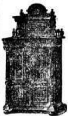
Vertikos von 30 Mark an

Dresden, König-Johann-Strasse Nr. 15, I.