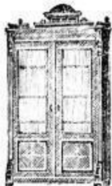
Bücherschränke von 30 Mark an.