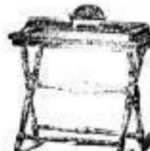
Servirtische von 11 Mark an.