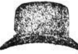
1 Hut in allen Farben und Formen, 3 M.