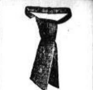
1 Cravatte, bunt, 30 Pf.

Referenzen in allen deutschen Provinzen, in Russland, Oesterreich, Schweiz, Belgien, Holland, Dänemark, Schweden u. Norwegen. Apotheker Albrecht's Apfelsäure-Pastillen sind das beste Erfrischungsmittel gegen Durst und Trockenheit des Rachens bei warmem Wetter; sowie als schmerzbringendes Mittel ärztlich empfohlen. Unentbehrlich anstatt Trankwasser für Reisende, Sportler und Militärs etc. Zu haben 4 Schachtel zu 80 Pfge. in der Salomon's-Apotheke, Mohren-Apotheke und Polapothek in Dresden.