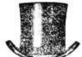
1 Cylinder, modern, 4 1/2 M. im Magazin zum Pfau, Frauenstrasse 8.

Dresdner Nachrichten, Seite 10, Sonnabend, 2. August 1890