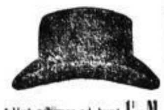
1 Hut, schwarz od. bunt, 1 1/2 M.