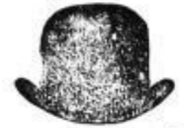
1 brauner Hut, 2 M.