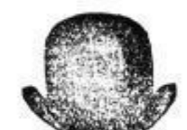
1 Hut, hochbelegant, in gewähltesten Farben, 4 M.