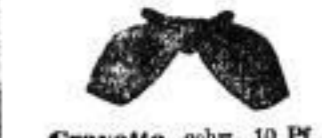
Cravatte, schw., 10 Pf.