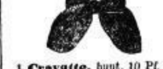
1 Cravatte, bunt, 10 Pf.