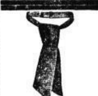
1 Cravatte, bunt, 30 Pf.

Reineite Old-Tafelbutter verwend. 8 in Kisth. 4 1/2 Sp. 1 1081 Wk. fr. u. Nachn. M. S. Dieck- mann, Schwei in Lüdenburg.