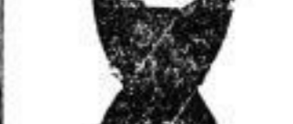
1 Doppel-Cravatte 25 Pf.