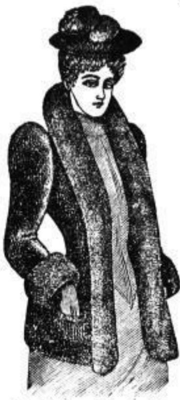
Sealskin - Jaquette "Columbia" mit nat. Hiber Mt. 300.