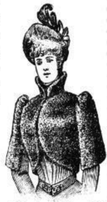
Pelerine „Stuart“ schw. Persischer Mt. 125 Bismarck-Mt. 170 Sealskin, echt. in drei Qualitäten.

Auf dem sich 40 Meter lang erstreckenden Lager der