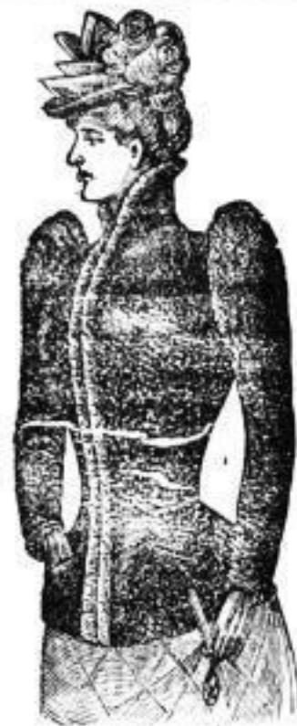
Façon „Eisach“, Jaquets von Seal von 330-550 Mark.