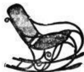
Schaukelstühle v. 10 Mark an, sowie alle anderen Möbel von massiv gebogenem Holz sehr billig. Praktisch und billig!