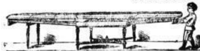
D. R. P. Echt nussbaum. Patent-Ruscheweyh-Ausziehtische von 72 Mark an.