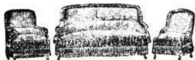
6. Polstergarnituren von 75 Mark an