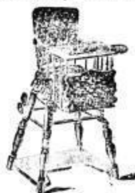
Stühle von 3 1/2 Mark an.