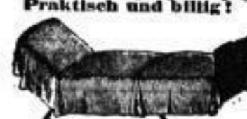
Sophabettstellen, zusammenlegbar, schmalebrenner Gestell mit Matrize, Keil- u. Federkissen, für beschränkte Raumverhältnisse sehr zu empfehlen, schon v. 12 Mark an.

Grösstes Lager Sachsens. Reichste Auswahl. Beste, solideste Arbeit. Billigste Preise. 23jährige unbedingte Garantie. Eigene Werkstätten. — Auf Wunsch Preiscourant gratis und franco. — Telephon Nr. 338.