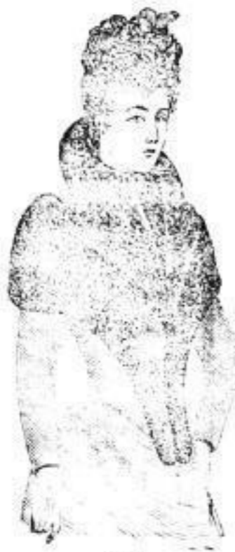
„Oka“, Färbung mit Seal. Schulter-Kragen von Seal, von 100-200 Mark. Müße von Seal von 30-55 Mark.

Dresdner Nachrichten. Nr. 314. Seite 12. Montag, 10. Nov. 1890.