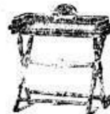
Servirtische von 11 Mark an.