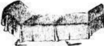
Sophabettstellen. Rahmenleib, schmeichelndes Gestell, mit Maträtze, Seit- und Zugfüßen, für beidseitige Klammereinstellung sehr zu empfehlen, schon von 12 Mark an.