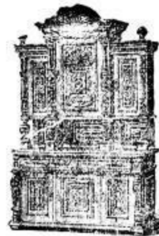
edlt möbl. furn. u. Spiegel mit edler Wappentafel von 150 Mark an.

Größtes Lager Sachsens. Reichste Auswahl. Beste, solideste Arbeit. Billigste Preise. 2-jährige unbedingte Garantie. Eigene Werkstätten. — Auf Wunsch Preiscourant gratis und franco. — Telefon Nr. 335. Alle gekauften Gegenstände werden franco Bahn- und Schiffstation Sachsens geliefert.