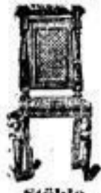
Stühle in all. Facen u. Besatzungen.