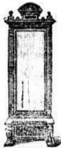
Spiegel mit Consolen und edler Wappentafel von 20 Mark an.