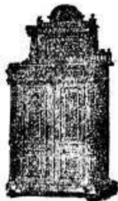
Vertikos von 30 Mark an.