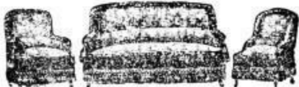
Polstergarnituren von 75 Mark an.