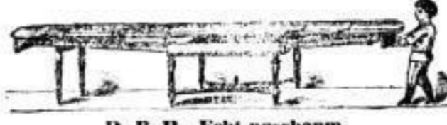
D. R. P. Echt nussbaum. Patent-Ruscheweyh-Ausziehtische von 72 Mark an.