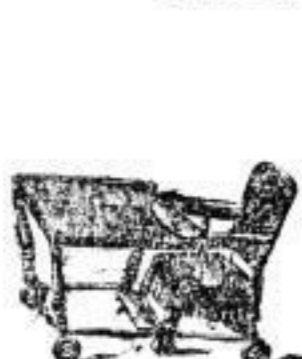
Kinderstühle in 15 verschiedenen Modellen von 12 Mark an.

Dresden, König-Johann-Strasse Nr. 15, I.