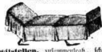
Sophabettstellen, zusammenlegbar, schwebende Gestell, mit Matratze, Stuhl u. Kissen, für bechränkte Mannschäfte sehr zu empfehlen, schon v. 12 Mark an.

Größtes Lager Sachsens. Reichste Auswahl. Beste, solideste Arbeit. Billigste Preise. 2jährige unbedingte Garantie. Eigene Werkstätten. — Auf Wunsch Preiscurant gratis und franco. — Telephon Nr. 338.