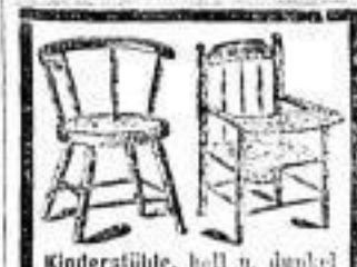
Kinderstühle, hell u. dunkel Mk. 1.50.

Ein Paar elegante halblinge Braune, 7 und 8 Jahre, in leichtem u. schwerem Zug geübt, Preis 1200 Mark; ein Paar Schwarzbraune 10-11 Mark, alle sehr gute reelle Pferde, lebhaft auch einzeln zu verkaufen. Th. v. Schabertstraße 1, Dresden.