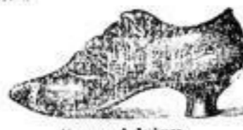
Form „Adrian“, eleganter Strassenschuh von Glanz-Hängs-Leder. Mark 10.-

Die Auswahl sämtlicher Schuhwaaren für Damen, Herren und Kinder ist die denkbar großartigste, die Formen von unübertroffener Eleganz, die verwendeten Lederarten von bewährter Haltbarkeit, bei sehr billigen Preisen.