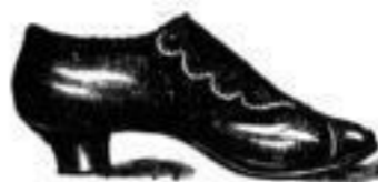
Form „Medusa“, zum Knöpfen, aus Ziegenchagrin oder mit Kullack-Blättern, mit schwarz oder gelb gedoppelten Sohlen. Mark 6.50.