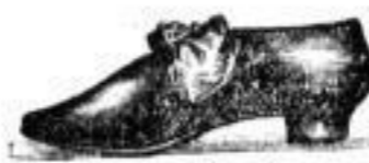
Form „Stephanie“, leichtester Promenadenschuh aus einem Stück, von ganz feinem Leder, für empfindliche Füße.