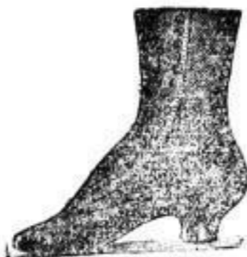
Form „Comfortable“, von feinstem Chevreux-Leder (Marke Grison, Paris).