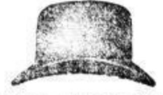
1 Hut in allen Farben und Lagen 3 M.