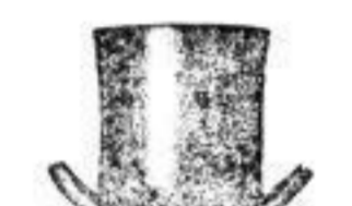
1 Cylinder, modern 4 1/2 M.