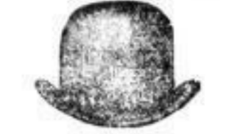
1 brauner Hat 2 M.