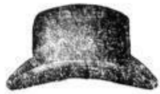
1 Hat, schwarz od. bunt 1 1/2 M.