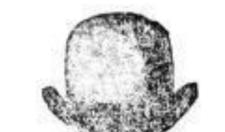
1 Hut, hochlegant, in neuesten Farben 4 M.