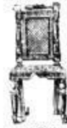
Stühle in allen Preisen.