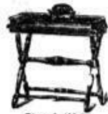
Zerbirtische von 11 an.