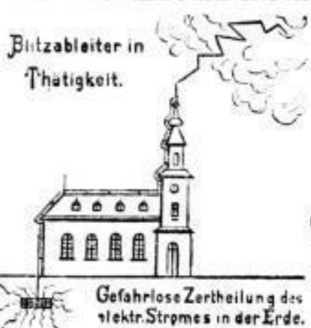
Blitzableiter in Thätigkeit.

Koppel & Co., Bankgeschäft, Schloßstraße 30, Ecke der Sporerstraße.