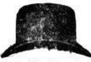
1 Hut in allen Farben und Façons . . . 3 M.