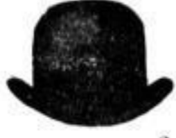
1 brauner Hut, . . . 2 M.