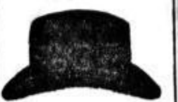
1 Hut, schwarz od. bun, 1 1/2 M.

Hoffmann's Stärke Hoffmann's Stärke Hoffmann's Stärke Hoffmann's Stärke Hoffmann's Stärke