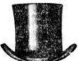
1 Cylinder, modern . . . 4 1/2 M.