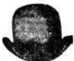
1 Hut, hochlegant, in gewählten Farben 4 M.