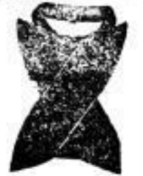
1 Doppel-Cravatte 25 Pf.