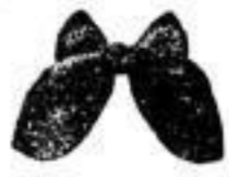
1 Cravatte, bunt, 10 Pf.