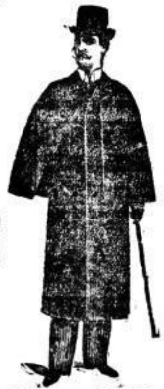
Havelock-Mantel mit langer Felleine.