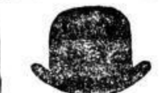
1 brauner Hut 2 M.