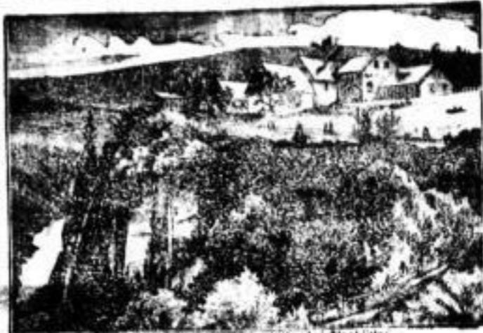
Ansicht der Rückenheimer Höhe bei Glashütte

20 Minuten von Glashütte, an d. Müglitzthalbahn, ist neu erbaut und erommet. Dieser Punkt ist der schönste des Müglitzthales und ist der Blick von da und die Lage besonders aberschieden schön. Angenehme Volatilitäten, kalte Speisen und vorzügliche Getränke. Zudem ist Naturfreunden dieses herrliche Bläuelchen Erde bestens empfehle, welche vornehmlich C. Jaenicke.