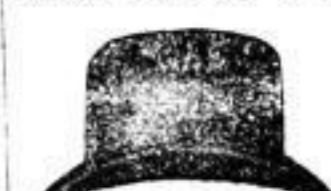
1 Hut in allen Farben und Facons 3 M.