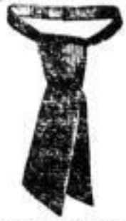
1 Cravatte, bunt, 30 Pf.

99. Deutscher a. W. 175. 2. 250, et. alter Cognac a. W. 1350. 1. 50, u. u. höher pro Flasche ab Köln wegen 1. 10. in Stück von 2. 10. 12. 18 bis 20. Können. Können billiger. Können. Können. Th. Können. Können. Können. Können. Können. Können. Können.