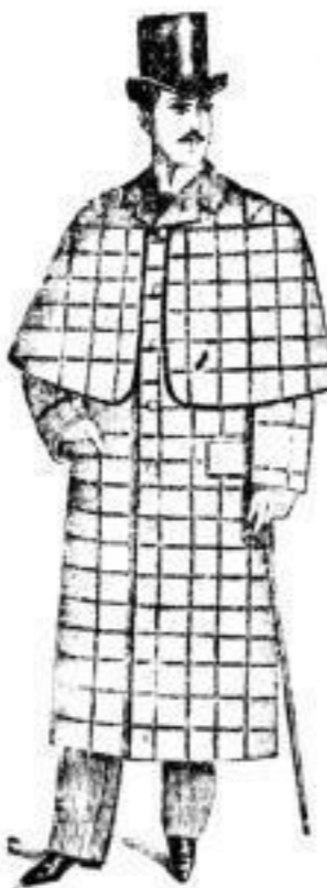
Stanley-Mantel mit langer Felleine.

aus guten trockenen Stoffen 30 bis 60 Mk., aus bestem Füll mit Militär-Lama 45-85 Mark.