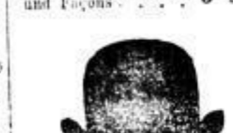
1 Hut, hochlegant in gewählten Farben 4 M.