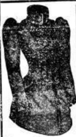
Façon Gaston Fischbein-Jacke, 13,50 Mk.