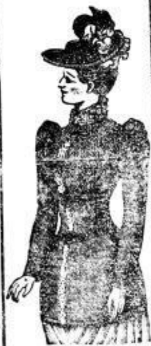
Façon Moskau Schook-Jacke, 14 Mark.