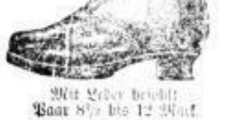
Mit Leder besohlt, Paar 8 1 / 2 bis 12 Mark.