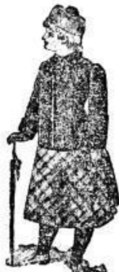
Winter-Jackets für Mädchen Nr. 5-15.

Tricot-Kleider und Anzüge, sowie ein Poiten Mädchen-Mäntel zur Hälfte des regulären Preises!