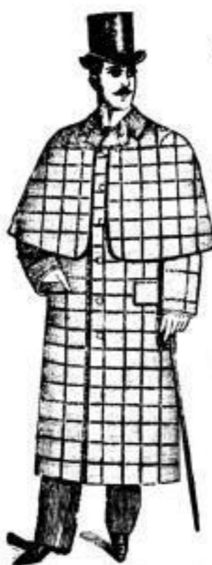
Stanley-Mantel mit kurzer Velleringe.

Die Firma S. H. Samter & Co. unterhält seit Jahren hier am Blöbe das größte Lager eleganter fertiger Herren-Kleidung. Die Confection ist eine durchaus solide und entspricht den weitgehendsten Wünschen der modernen Herrenwelt. Die Firma hält nach wie vor an ihrem alten Principe fest, stets das Neueste und Beste zu dem denkbar billigsten Preise zu verkaufen.