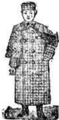
Knaben-Paletots Nr. 4-18.