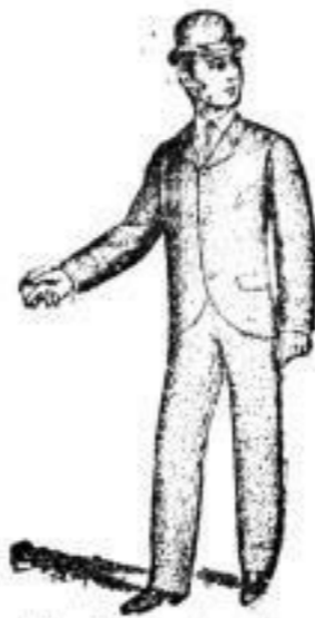
Jünglings-Anzüge Nr. 11-30.