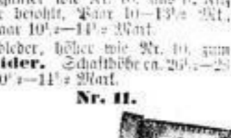
Mit Leder besohlt, Paar 10 1 / 2 bis 11 1 / 2 Mark.