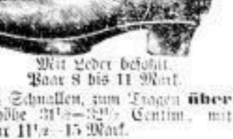
Mit Leder besohlt, Paar 8 bis 11 Mark.