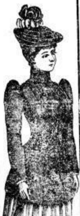
Façon Berolina Fischbein-Jacke, 12 Mark.