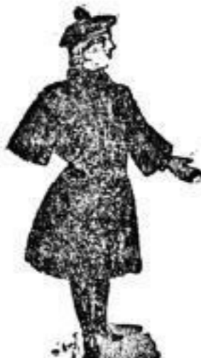
Winter-Mäntel für Mädchen Nr. 4 1/2-30.