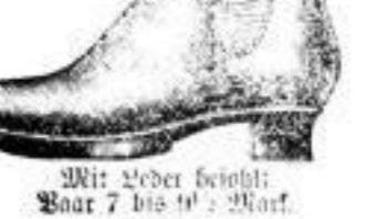
Mit Leder besohlt, Paar 7 bis 10 1 / 2 Mark.