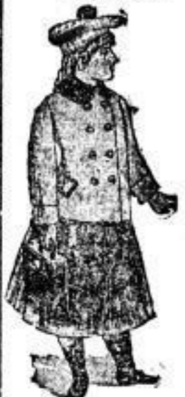
Herbst-Jackets für Mädchen Nr. 4-12.