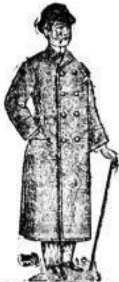
Jünglings-Paletots Nr. 9-30.