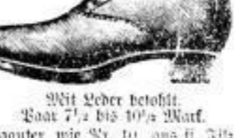
Mit Leder besohlt, Paar 7 1 / 2 bis 10 1 / 2 Mark.