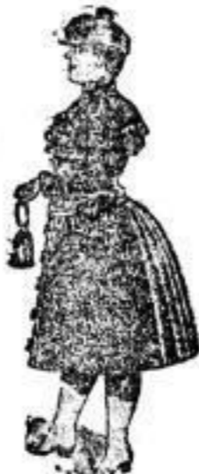
Regen-Mäntel für Mädchen Nr. 2 1/2-25.