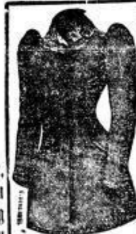
Façon Curt Wiener Jacke, 16,50 Mk.