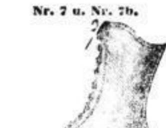
Nr. 7 u. Nr. 7b.

weiches, hartes Oberleder mit Filzfüßler, Paar 3 bis 3 1 / 2 Mark, dito für Damen Paar 2 1 / 2 bis 2.75 Mark, dito für Kinder Paar 2 bis 2.25 Mark.