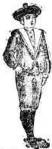
Knaben-Anzüge Nr. 5-20.