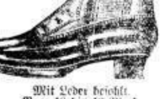
Mit Leder besohlt, Paar 10 bis 13 Mark.