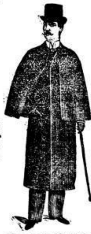
Havelock-Mantel mit langer Velleringe.

Hohenzollern-Mäntel aus guten tragbaren Stoffen 30 bis 60 Mk., aus bestem Duffel mit Militär-Passa 45-85 Mark.