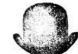
1 Hut in schwarz in gewähltesten Farben. . . . . 4 M.