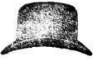
1 Hut in allen Farben und Fasern. . . . . 3 M.