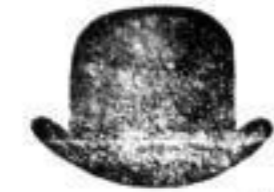
1 breiter Hut. . . . . 2 M.