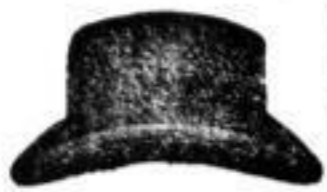
Hut, schwarz od. bunt. 1 1/2 M.