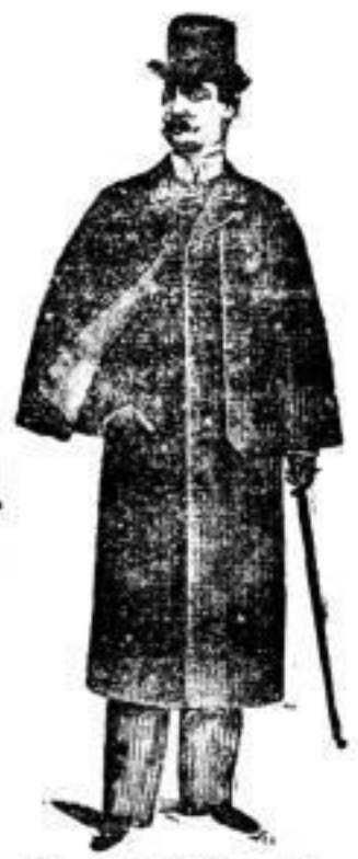
Havelock-Mantel mit langer Pelzlinie.

Englische Havelocks (wasserdicht) 15-36 Mk. Havelock - Mäntel, aus karierten Cheviots, 25-60 Mark. Kaiser - Mäntel (zweifach) mit 40 cm breiter Pelzlinie 22-46 Mark. Hohenzollern - Mäntel aus guten höchsten Stoffen 30 bis 60 Mk., aus weichen Stoffen mit Militärkragen 45-85 Mark.