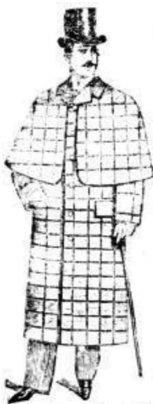
Stanley-Mantel mit kurzer Pelzlinie.

Die Firma S. H. Samter & Co. unterhält seit Jahren hier am Platze das größte Lager eleganter fertiger Herren-Kleidung.