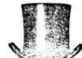
1 Hut in schwarz. . . . . 4 M.