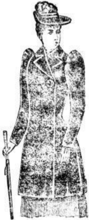
Senorita, Sealskin, I. Qualität, 800.—