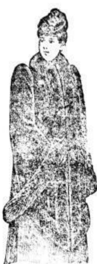
Hidalgo, Sealskin, I. Qualität, 850.—