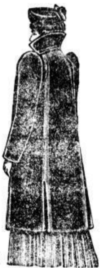
Americano, Sealskin, extra Qualität, 800.—