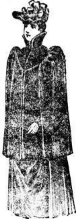
Imperial, Sealskin, I. Qualität, 500.—