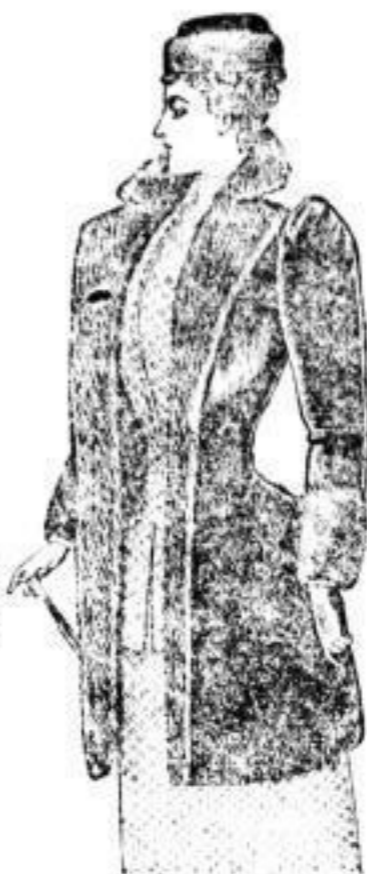
Rayar, Sealskin, extra Qualität, 950.—