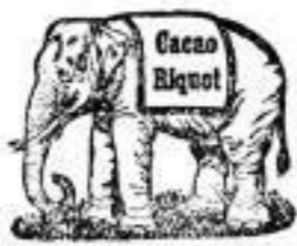
Sei gut bekömmlich.