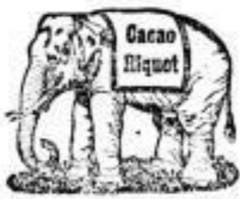
Sei leicht verdaulich.