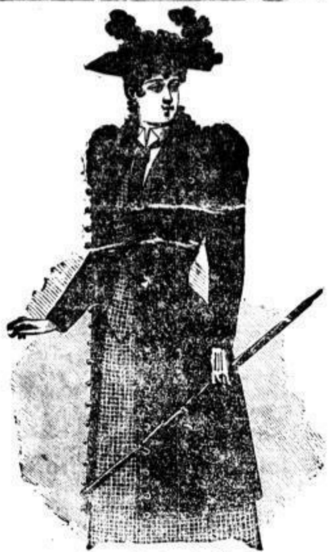
Korset „Santozza“, 6 Mark.

Einziges Confectionshaus seit Gründung mit „streng festen Preisen“.