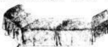
Chaiselongue, Zouha-Vertheiler, etc.