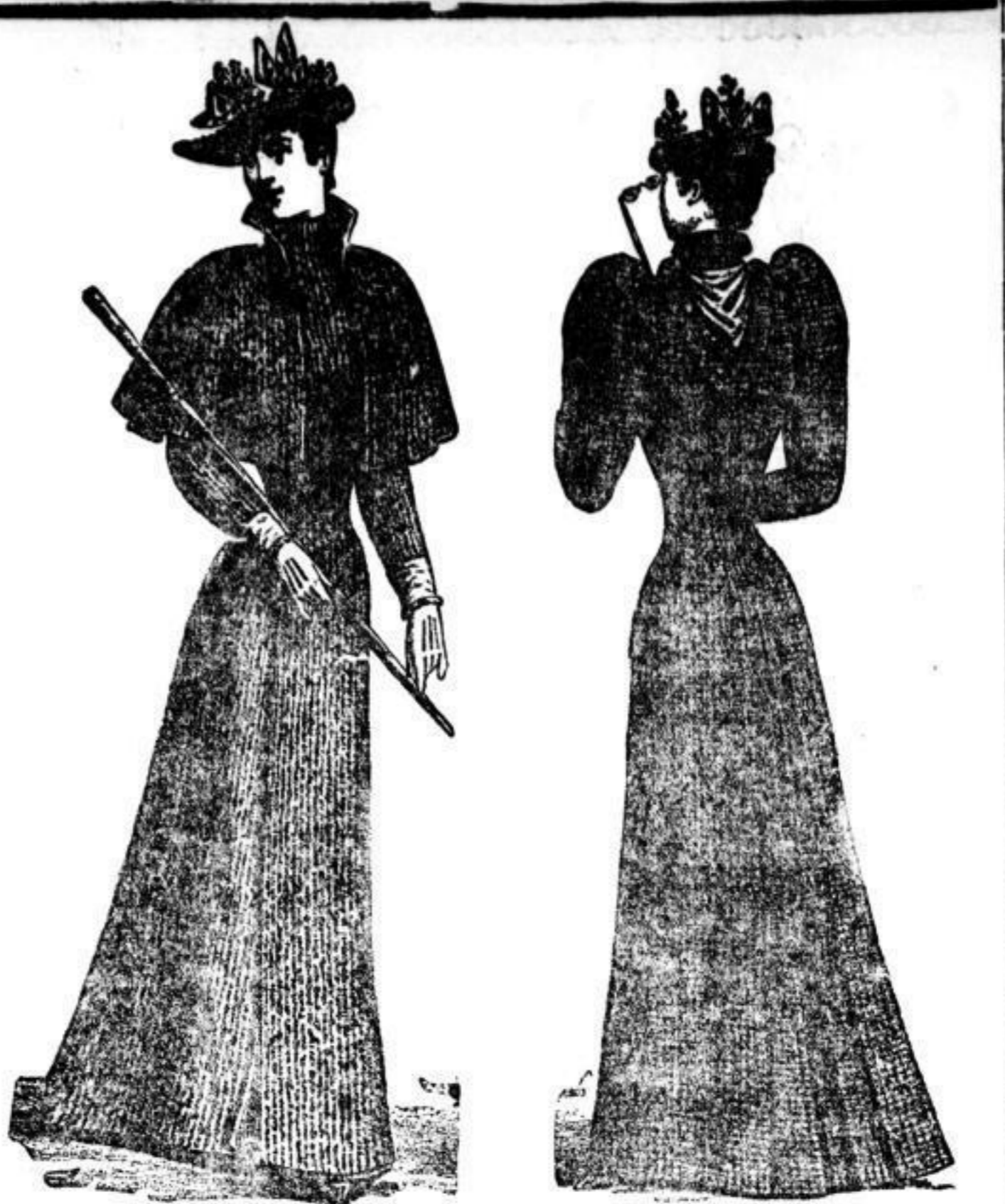
Form Wales. Original englischer Mantel mit abnehmbarem Pelzreim. In Himalaya- u. Noppen-Stoffen Mk. 23,—. Form Schiller. Anliegender Paletot mit Capuchon. In Noppenstoff (engl. Art) Mk. 20,—. In blau u. melirt Cheviot Mk. 19,—.

Kreuzf. Pianino, nachdruck im Ton, gegen Kaffe bill. zu verk. Rüstschloß, 26, 1.