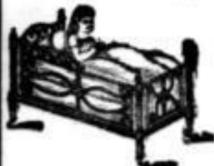
Großes Lager von

Volgt & Dresden, Kaufhaus, Seestraße 21.