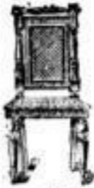
Stühle in allen Größen