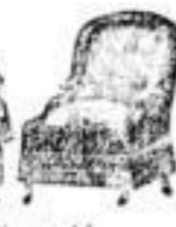
Vollzeugsamituren in großer Auswahl in Cretonne von 75 M. an, in Plüsch von 150 M. an