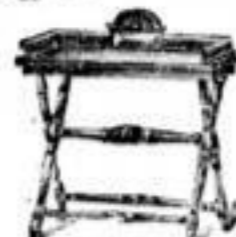
Zerbstische von 11 Mark an