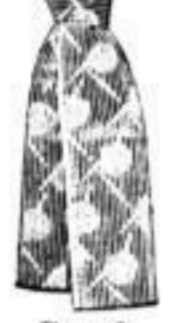
Grand, für Umlegekragen, eleg. ausgestattet, Mk. 2 1/2, 3.-.

Schwarze Cravatten, alle modernen Formen am Lager, grosse Abwechslung in den Stoffen.