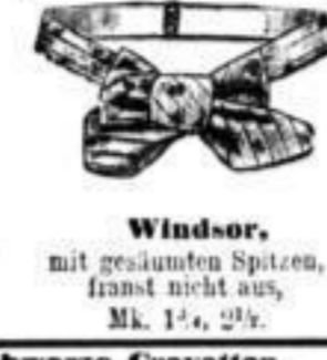
Windsor, mit gesäumten Spitzen, franz. nicht aus, Mk. 1 1/2, 2 1/2.

Aufträge werden thunlichst noch am Tage des Eingangs er- ledigt. Das Geld ist der Bestellung gleichzeitig per Post- anweisung beizufügen; wo solches nicht geschehen, wird der Betrag nachgenommen.