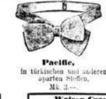
Pacille, in türkischen und anderen aparten Stoffen, Mk. 3.-.