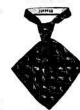
Dandy. Letzte Neuheit, praktisch, weil 1 Mal zu ändern, Mk. 3.-, 4.-.