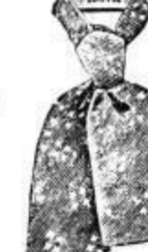
Sidney, elegante Form, Mk. 1 1/2, 3.-.