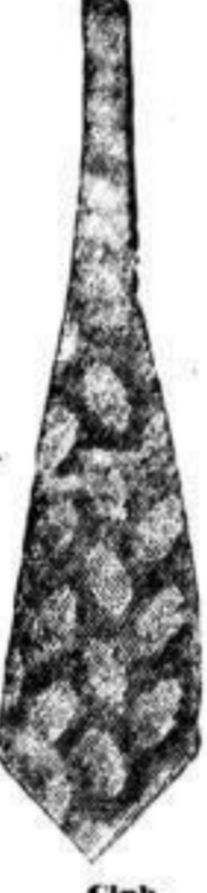
Club, Selbstbinder mit breiten Spitzen, Foulard 2 1/2, Seide 3 1/2, 4 1/2