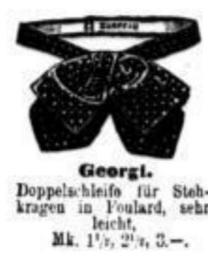
Georgi. Doppelschleife für Stoh- kragen in Foulard, sehr leicht, Mk. 1 1/2, 2 1/2, 3.-.

Günstige Offerte. Ein hochfeines, sehr frequent. Etablissement mit groß. Saal, großartig schönem Garten, am Fuße des Hochgebirges ruhend gelegene, massiver Touristen- verkehr, ist wegen vorgerückten Alters des Besitzers unter günstigen Bedingungen sofort zu verkaufen. Nähere Aus- kunft ertheilt Paul Ratschke, Bunzlau, Affenscamp-Verf.