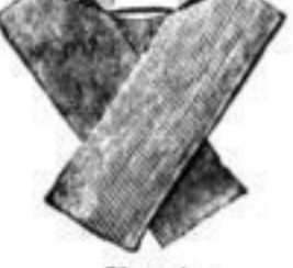
Ernst, den vorwiegendsten Ge- schmack befriedigende Auswahl in Stoffen, Mk. 1 1/2, 2.-.

Weiße Cravatten, gewählt in dattigen Stoffen und nicht zu rasch vergänglich in den Formen.