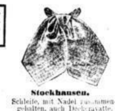
Stockhausen. Schleife, mit Nadel zusamen- gehalten, auch Deckcravatte, Mk. 1 1/2, 2.-, 2.-, 2 1/2.