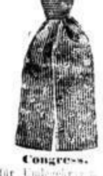
Congress. für Umlegekragen in besten Stoffen, Mk. 1 1/2, 2.-, 2 1/2.