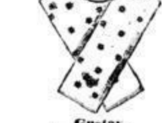
Gustav, für Umlegekragen, tiefen Westenaus- schnitt genügend, Mk. 1.-, 1 1/2.