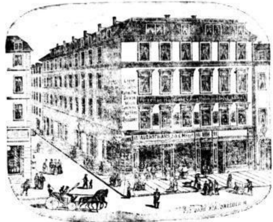
empfehle in größter Ausdehnung:

Ecke Quergasse Scheffelstr. 11 Ecke Quergasse