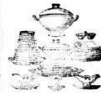
Tafel-Servicees, über 200 Sorten, für jedes Zimmer von 12 Personen, 12 Theile von 60 M. an.