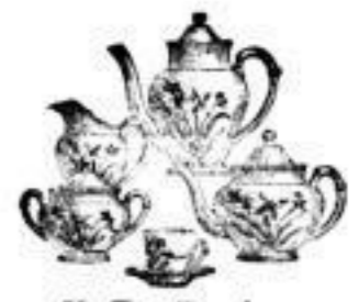
Kaffee-Servicees, größtes Lager, solide Qualität, ist zu außerordentlich billigen Preisen.

Ecke Quergasse Scheffelstr. 11 Ecke Quergasse