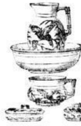
Wasch-Garnituren, über 200 Sorten, für jedes Zimmer von 3 M. 50 P. an.