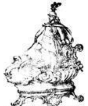
Vasen, Jardinières, Büchertische, Wandplatten etc.

Hochzeits-, Silberhochzeits- und Gelegenheits-Geschenke Braut-Ausstattungen. Hotel- und Restaurant- Einrichtungen.