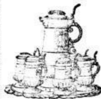
Bier-Servicees, Bowlen, Zedel, Gläser etc.

Hochzeits-, Silberhochzeits- und Gelegenheits-Geschenke Braut-Ausstattungen. Hotel- und Restaurant- Einrichtungen.