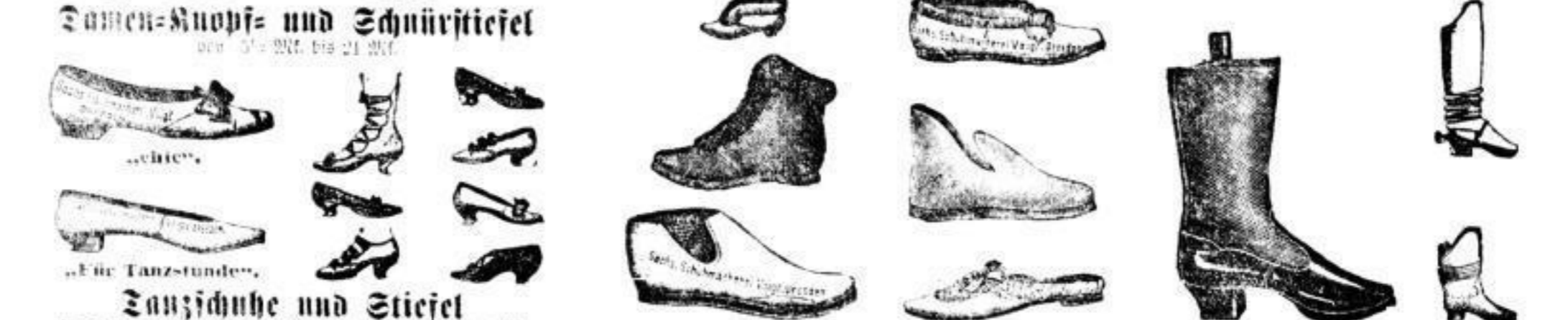
Damen = Knopf- und Schnürstiefel von 3 1/2 Mk. bis 21 Mk.