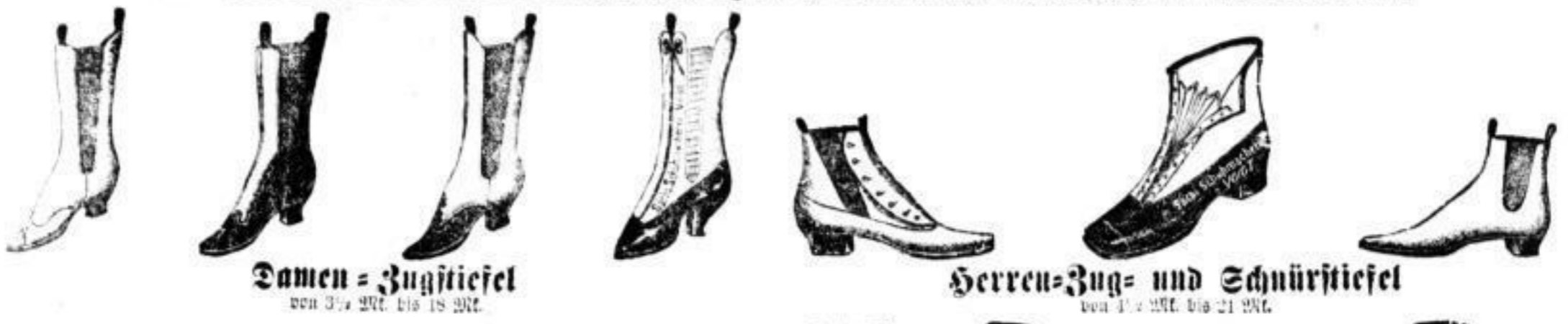
Damen = Zugstiefel von 3 1/2 Mk. bis 18 Mk.

in allen Federn, Lantio, Tuch, bair. Filz, Serge, Gantalfleder u. f. w. mit Kork-Zwischensohlen , welche wärmer als Holzsohlen, dabei federleicht sind.