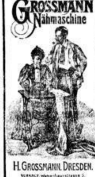
H. GROSSMANN, DRESDEN.

Ein neues Telephone-Gespräch... Die Vorteile sind: 1. Einfachheit der Bedienung. 2. Geringe Kosten.